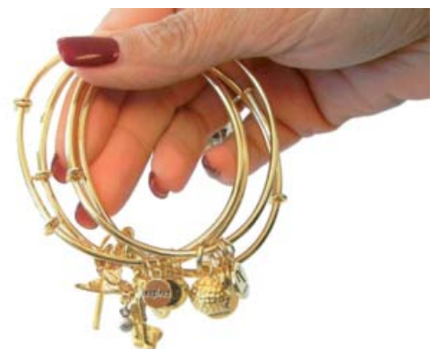
Kombinieren nach Lust und Laune!