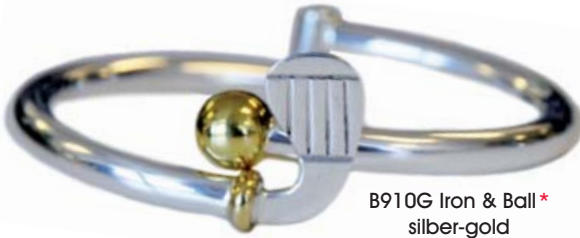
B910G Iron & Ball* silber-gold