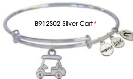
B912S02 Silver Cart*