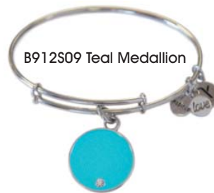
B912S09 Teal Medallion