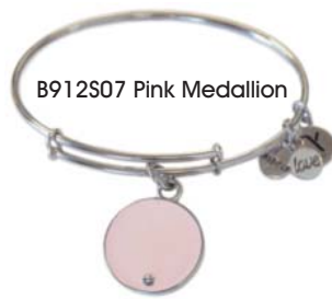
B912S07 Pink Medallion