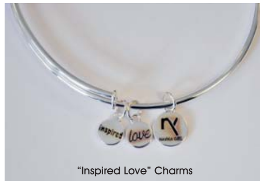
"Inspired Love" Charms