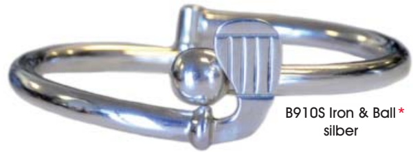
B910S Iron & Ball* silber

B912G Elegante Armspangen aus Sterling Silber, vergoldet, weitenverstellbar. Mit verschiedenen Charm-Anhängern. Einzeln verpackt im goldenen Organzabeutel.