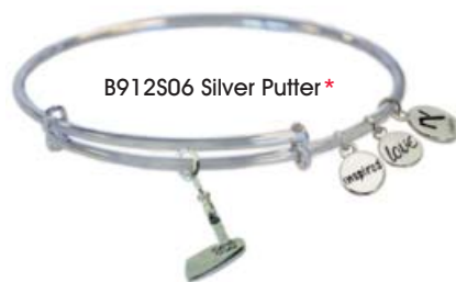
B912S06 Silver Putter*