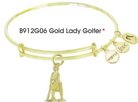
B912G06 Gold Lady Golfer*