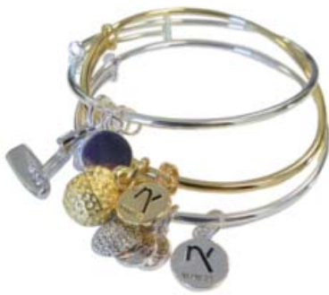
Kombinieren nach Lust und Laune!