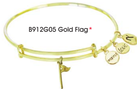
B912G05 Gold Flag*