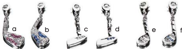
a. CH1027-1 Eisen pink b. CH1027-2 Eisen blau c. CH1025-1 Putter-klar d. CH1025-2 Putter-blau e. CH1026-1 Driver-clear f. CH1026-2 Driver-blau