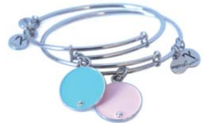
B912S10 Pink-Teal Combo