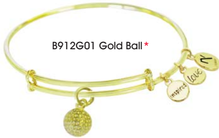
B912G01 Gold Ball*

Einzeln oder vielfach kombiniert - mit diesen filigranen Armspangen machen Sie Ihre Liebe zum Schönen Spiel zu einem modischen Statement der besonderen Art!