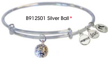
B912S01 Silver Ball*

Einzeln oder vielfach kombiniert - mit diesen filigranen Armspangen machen Sie Ihre Liebe zum Schönen Spiel zu einem modischen Statement der besonderen Art!