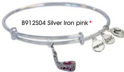
B912S04 Silver Iron pink*