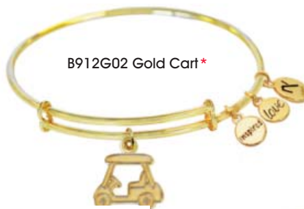
B912G02 Gold Cart*